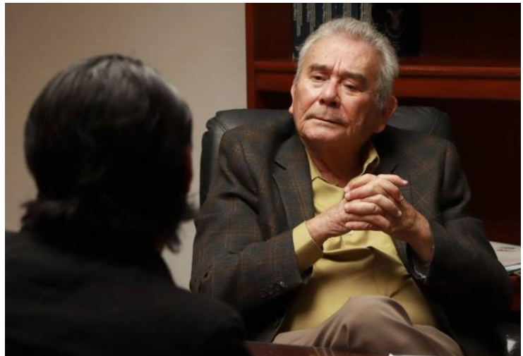
El magistrado presidente combatirá la corrupción en la impartición de justicia

“La prioridad que tenemos, además de impartir justicia en cuestiones penales, civiles, mercantiles, etcétera, tenemos enfrente la impartición de justicia en materia laboral. A partir del 1 de mayo, la competencia para emitir sentencias