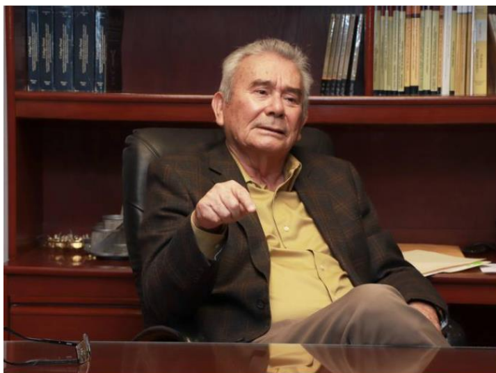
Aseguró que bajo su mandato no permitirá actos de corrupción

Dentro de este esquema, Hermosillo y Obregón tendrán capacidad para resolver problemas laborales individuales y colectivos, sobre todo