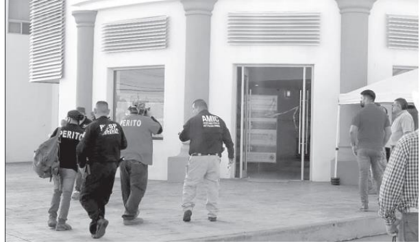
• Policías investigadores realizan las primeras indagatorias en el juzgado familiar.